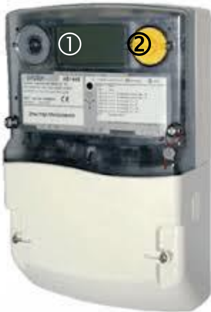
Frontansicht des AS1440